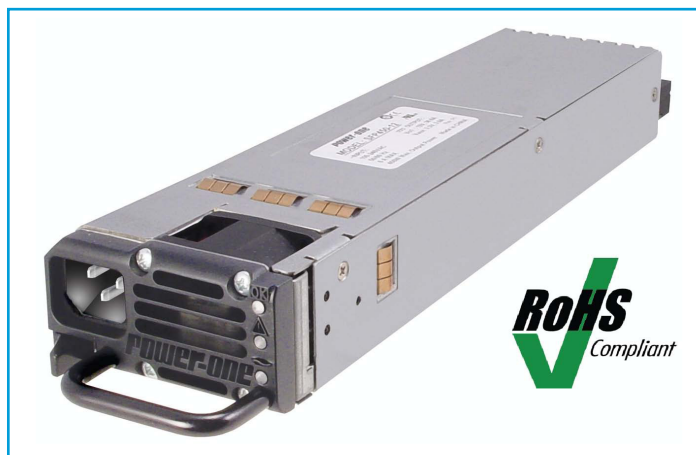
De nieuwe 450Watt Hot-Swap Ac/DC Front-End

Uiteraard is de nieuwe 450Watt Hot-Swap Ac/DC Front-End te zien tijdens de Mocon in stand 1132 van Dracon-Eltron.