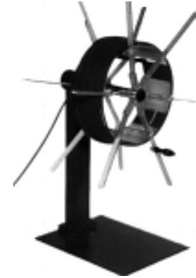
TISCHROL 2 EXCL. WIKKELKOP