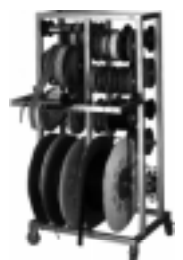
AFWIKKELREK KW 500D

Haspelafwikkelrek voorzien van 20 assen geschikt voor haspels met een maximale diameter van 500 mm. Onderstel voorzien van 4 wielen. Afmetingen haspelrek (BxHxD) 630x1330x500 mm.