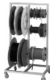
AFWIKKELREK KW 500

Haspelafwikkelrek voorzien van 10 assen geschikt voor haspels met een maximale diameter van 500 mm. Onderstel voorzien van 4 wielen. Afmetingen haspelrek (BxHxD) 630x1330x500 mm.