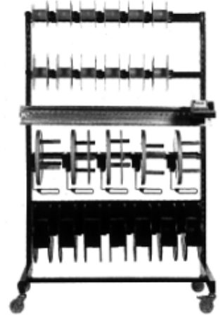
KABELREK (V SERIE)