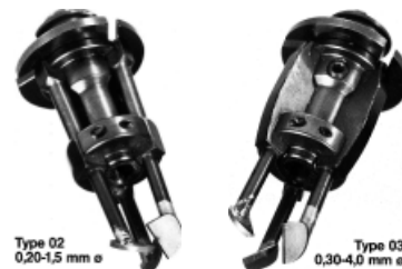
Type 02 0,20-1,5 mm ø